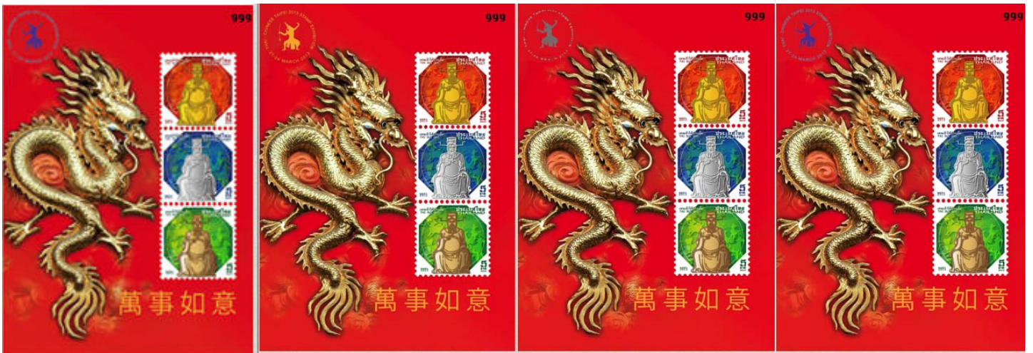
ตัวอย่างแผ่นตราไปรษณียากรที่ระลึกพิเศษของงานแสดงตราไปรษณียากรระหว่างไทย-ไชนีสไทเป พ.ศ. 2556